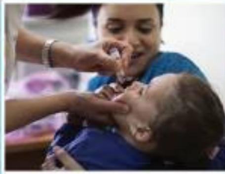
البرنامج الوطني للتطعيم في قطر