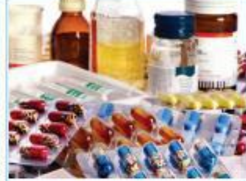
توفير الأدوية والعلاج

- لاحظ الصُّورَ السَّابِقَةَ، وَناقِشْ زُمَلَاءَكَ: ماذا يَحْدُثُ إذا لَمْ تَتَوَافَرَ الْخِدْمَاتُ الصِّحِّيَّةُ السَّابِقَةُ بِدَوْلَةِ قَطَرْ؟ تكثر الأمراض والأوبئة