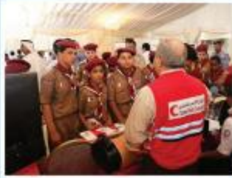
حملات التوعية والتنظيف الصحية